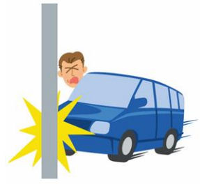
運転中の事故で亡くなりました。