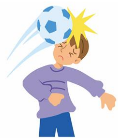
スポーツ中にケガをして通院した。