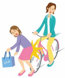
自転車で走行中、歩行者にぶつかりケガを負わせた。