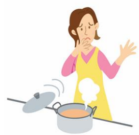
料理中にヤケドをして通院した。