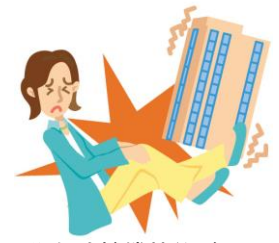
天災危険補償特約がセットされていますので、地震、噴火またはこれらによる津波によりケガをされた場合にも保険金をお支払いします。