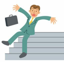
階段で足を踏み外し骨折して入院し、手術をした。