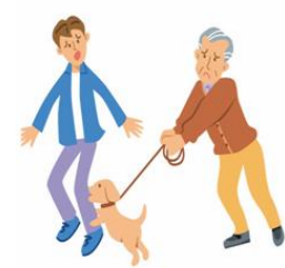
飼い犬が他人に噛みついてケガを負わせた