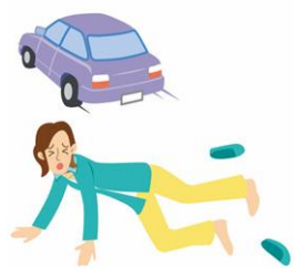
自転車のタイヤに足が引っかかって、後遺障害が生じた。